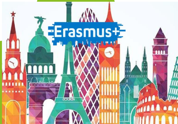
možnost výjezdu do zahraničí