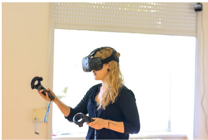
výuka s využitím VR