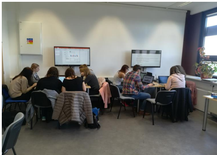
moderně a prakticky pojatá výuka

Zhlédněte další fotografie v naší fotogalerii ZDE!!!