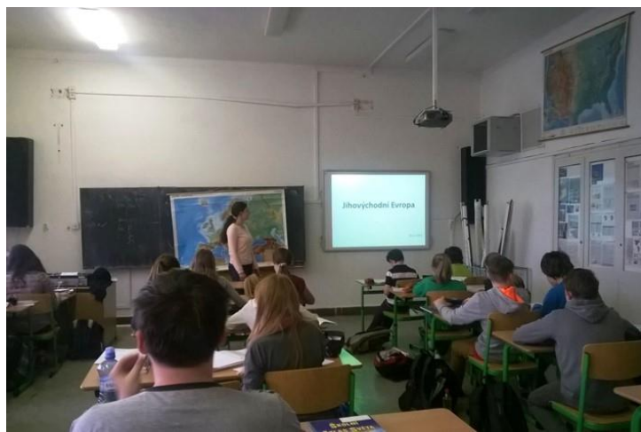
praxe ve školách