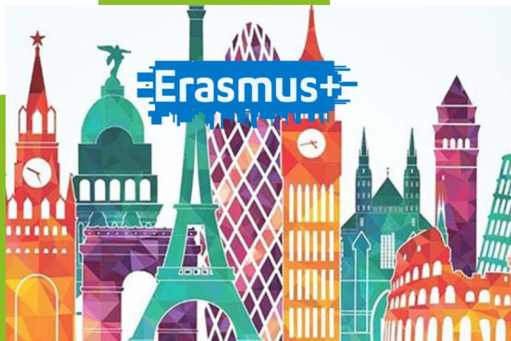
možnost výjezdu do zahraničí