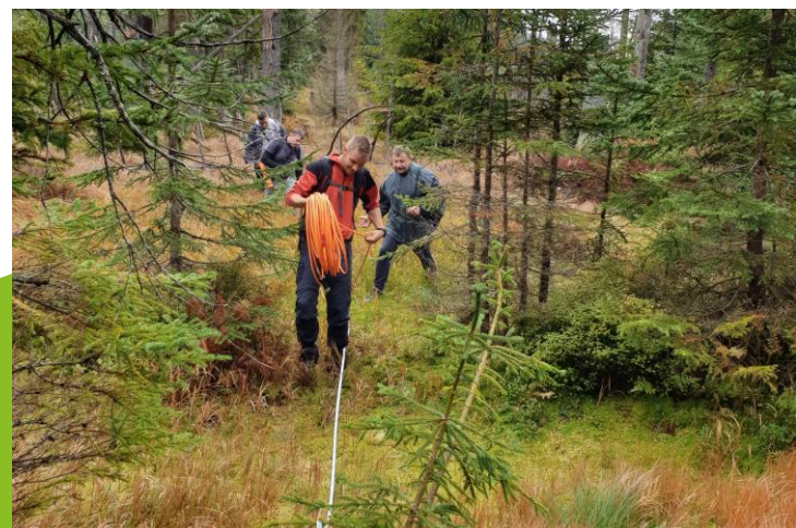
možnost účasti na výzkumu