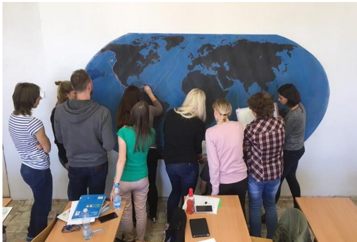
moderně a prakticky pojatá výuka

Zhlédněte další fotografie v naší fotogalerii ZDE!!!