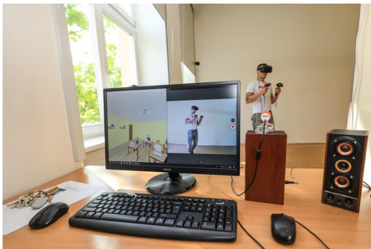
jedinečný didaktický trenažer